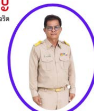
นายคลัง ฉลอง นายกององค์การบริหารส่วนตำบลวัดหลวง